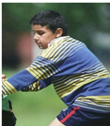
CSR/Nanok rugbyklub som 9-årig.

Jeg havde spillet rugby på Blågård Skolen i et par uger inden jeg skulle til mit første stævne for