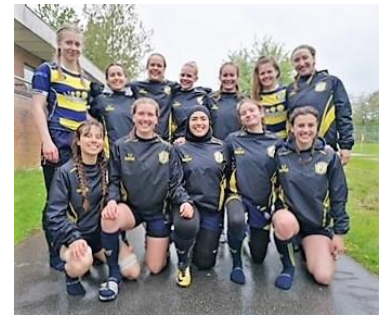
Shada midt nederste række

Nogle gange var vi heldige og være 4 personer til træning. Undervejs kom der så småt flere til og så fik vi endelig stillet et helt CSR Damehold.