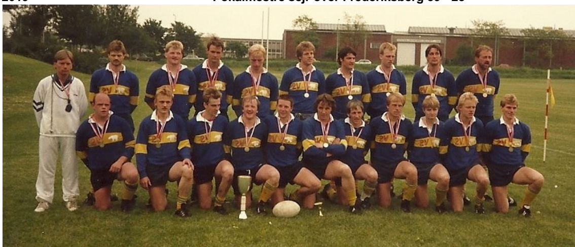
Danmarksmestre første gang 1987