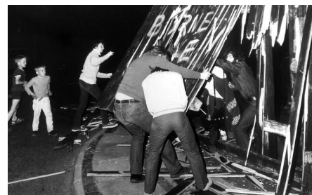
Må indrømme, det er mig i hvid islænder i midten

Meget sker jo på Christianshavn de år. Ungdomsoprøret i 68 skaber Sofiegården, som besættes og ryddes af politiet. Og bygges op som kollegie. Bådsmannsstræde Kaserne forlades af militæret. Jeg er med til at rive plankeværket ned på hjørnet af Refshalevej og Prinsessegade i 1970 for at få en større grund til de små unger – og hermed åbnedes porten og der dannes grundlaget til Christiania. Vi fik dog en grund til en byggelegeplads på det andet hjørne, så vores aktion hjalp. Og så er det senere blevet verdenshistorie.