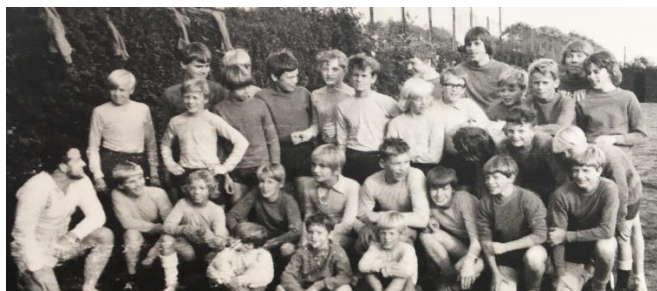
30 skolespillere - første opvisningskamp 6/9-1970